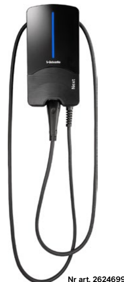
Nr art. 2624699