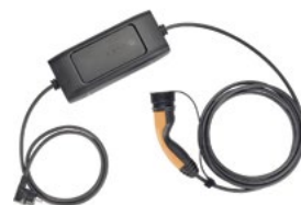
Nr art. 2337715