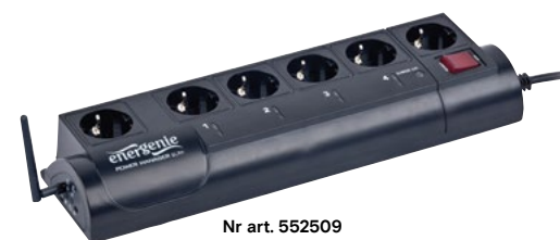
Nr art. 552509