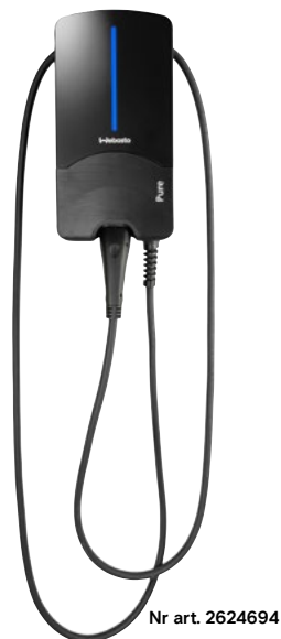
Nr art. 2624694